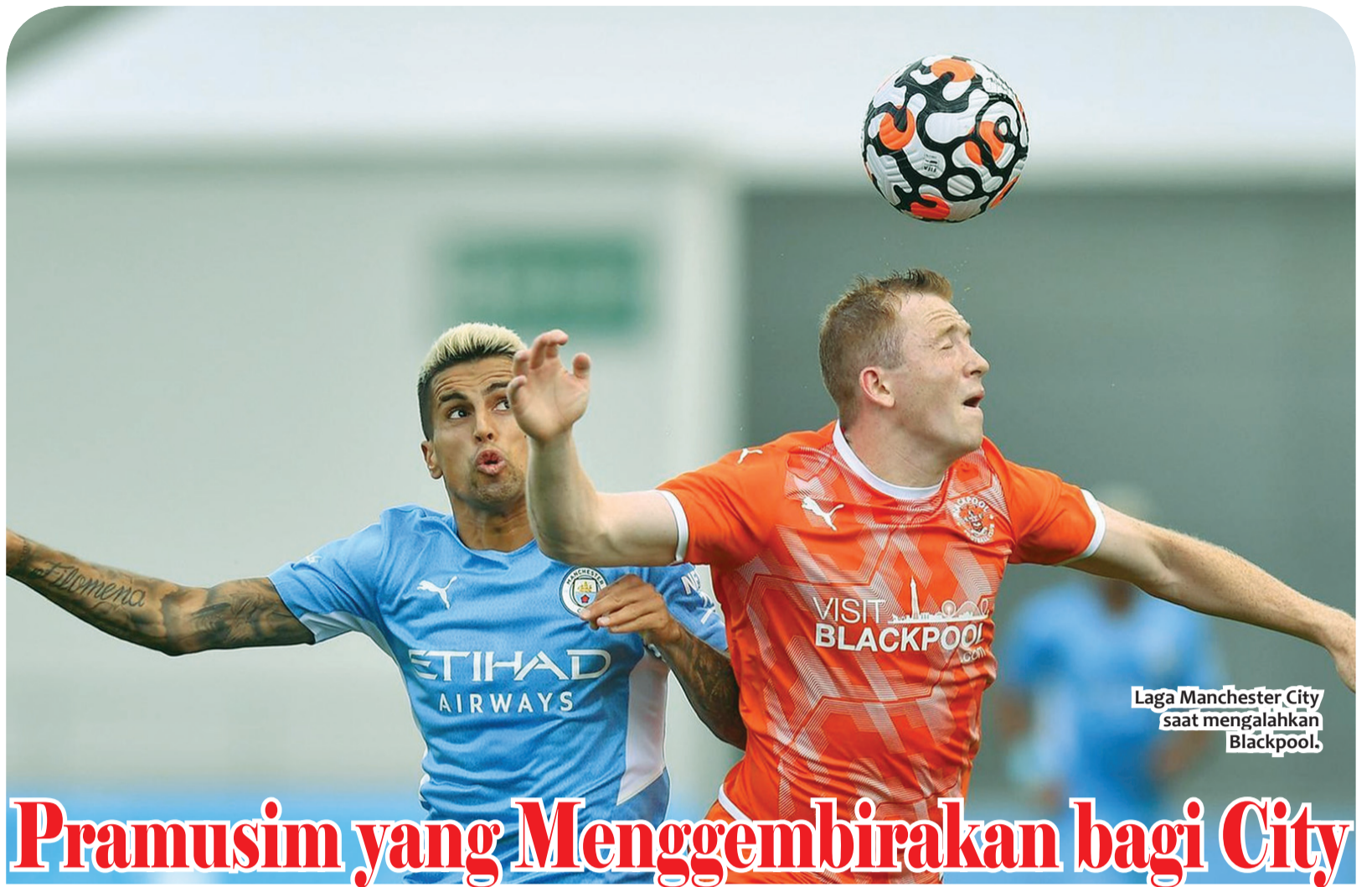
Laga Manchester City saat mengalahkan Blackpool.