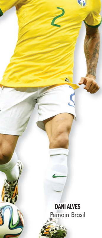
DANI ALVES Pemain Brasil